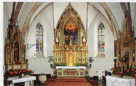
Kirche St. Vigilius, Seitenaltar mit Gnadenbild (r.).