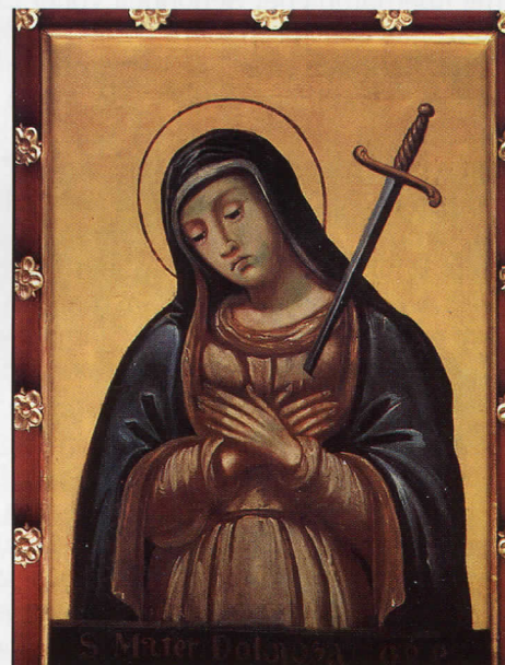
Das Gnadenbild der schmerzhaften Mutter Gottes mit gesenkten Augen, aus denen je eine Träne über die blassen Augen herunterrollt, mit über die Brust gekreuzten Händen und dem Schwerte im Herzen.