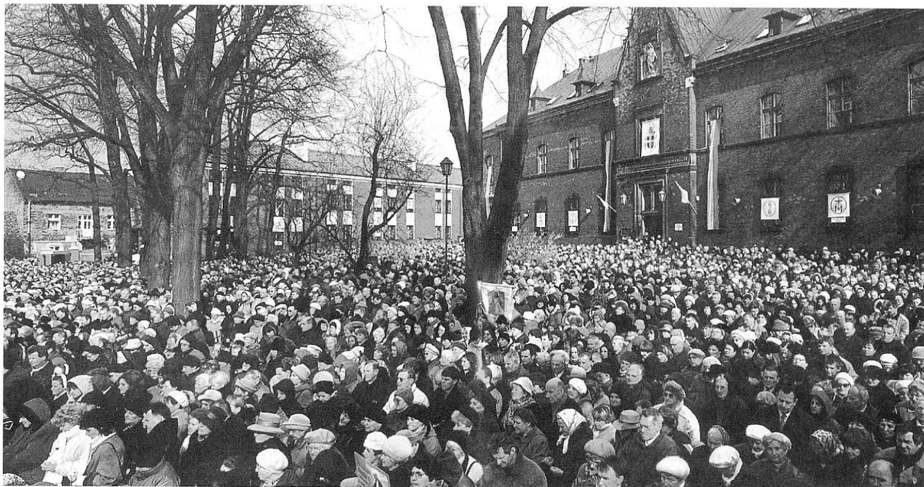
Verehrer der Göttlichen Barmherzigkeit vor dem Klostergebäude in Krakau.